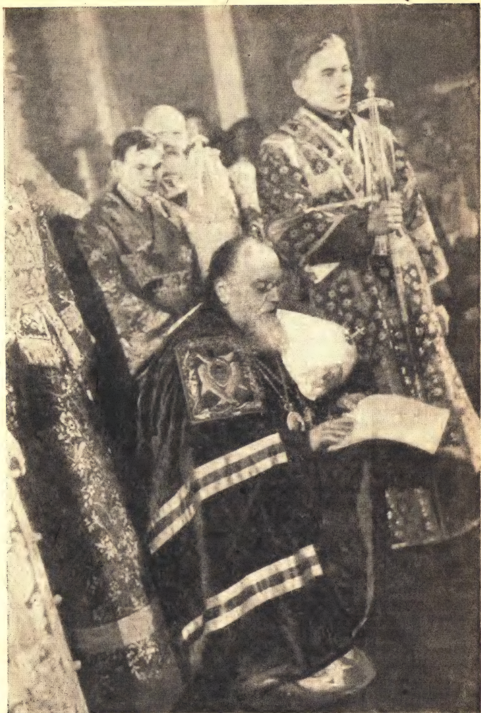
Святейший патриарх Алексей коленопреклонно читает молитву во время своей интронизации